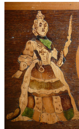
Sonderausstellung 2010 Probsteier Familienschätze Keramik, Textiles, Silber, Mobiliar